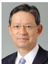
末吉 竹二郎 (Takejiro Sueyoshi) 国連環境計画・金融イニシアティブ 特別顧問